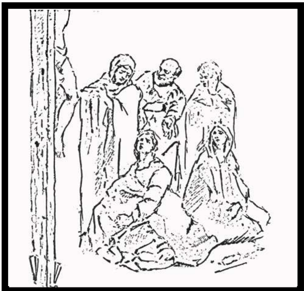
Boceto de estandarte de Fernando López Pascual, 1985